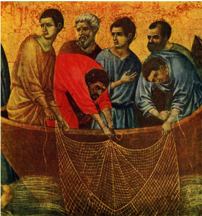
Дуччо ди Буонинсенья. Призвание апостолов

обыденному, что у них было на земле: ремесло, дом, семья, обычное окружение. И когда они занялись только самым обычным, когда воспоминание об Иисусе, встреченном в Иудее, осталось у них в сердцах, а жизнь продолжала идти своим чередом, Спаситель снова прошел мимо них, и теперь уже не предлагая ничего, Он повелел: Идите за Мной! – и они оставили всё и пошли.