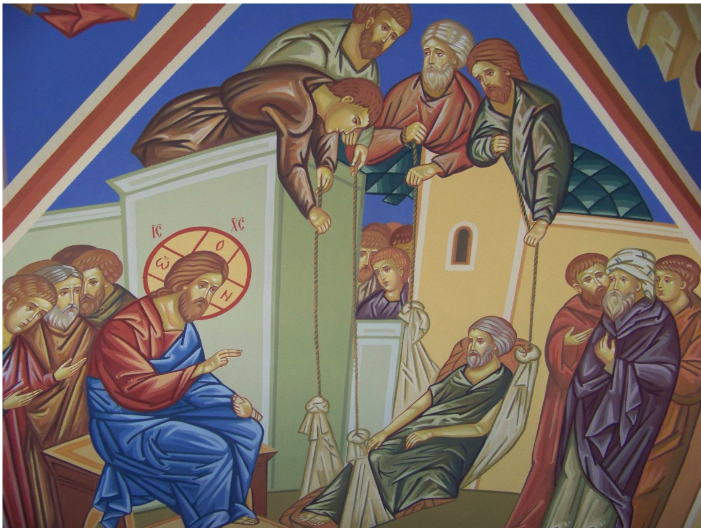
Росписи сводов храма Живоначальной Троицы г. Петропавловска-Камчатского, п-ов Камчатка

будь то радость – это его частное дело. А на самом деле, это дело всей общины, потому что каждый из нас друг другу свой. Как бы было хорошо, если бы мы, может быть, не всем сердцем, но хотя бы сознанием своим так относились друг ко другу: он – мой, мы друг другу свои, что с ним происходит, не может быть для меня безразличным: это происходит со мной, потому что он и я – одно, живое тело, живая душа.